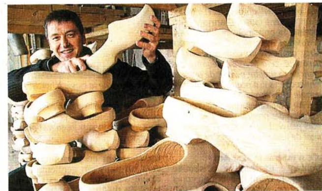
La société Audouin de Montfaucon-Montigné (20 salariés) est la seule en France à perpétuer la tradition des sabots de bois. Destinée aux jardinières, la production part aussi à l'étranger grâce à une diversification réussie vers le haut de gamme. Huit sabots « haut de gamme » sur 10 sont exportés vers neuf pays européens.