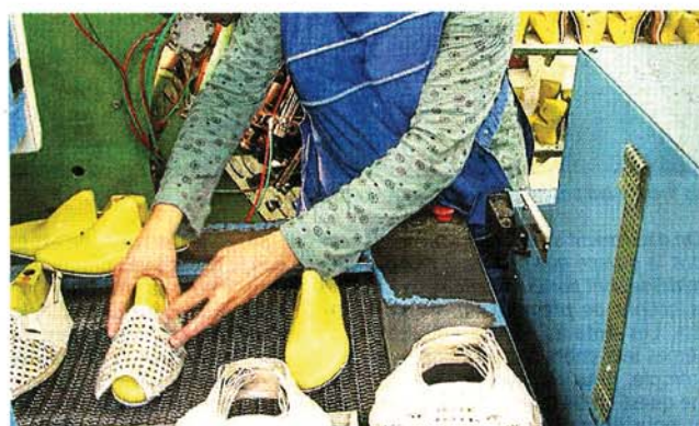
À Saint-Léger sous Cholet, Samson perpétue la tradition choletaise en proposant des chaussures dites de confort sous les marques Hasley, Artika, etc. Très prisées en Russie, les chaussures saint-légoises doivent en partie leur survie à ce marché, l'entreprise Samson étant confrontée à une baisse du marché hexagonal.