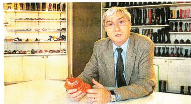
La société Umo de Pierre Humeau à Beaupréau décline toute une gamme de bottes de loisirs, bottes de chasses, bottes de pêche, bottes d'équitation, cuissardes, sabots de jardin, tong, sandales, mules et bottes de neige... et même la fameuse Méduse.