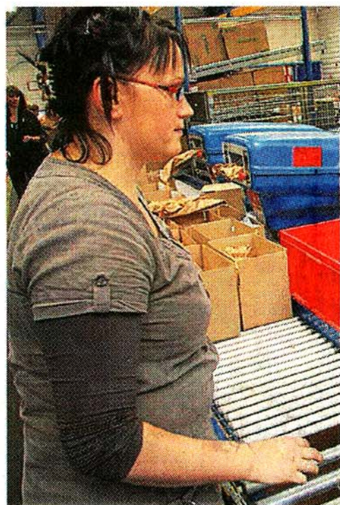
Pileje va agrandir son bâtiment logistique à Saint-Laurent-des-Autels.