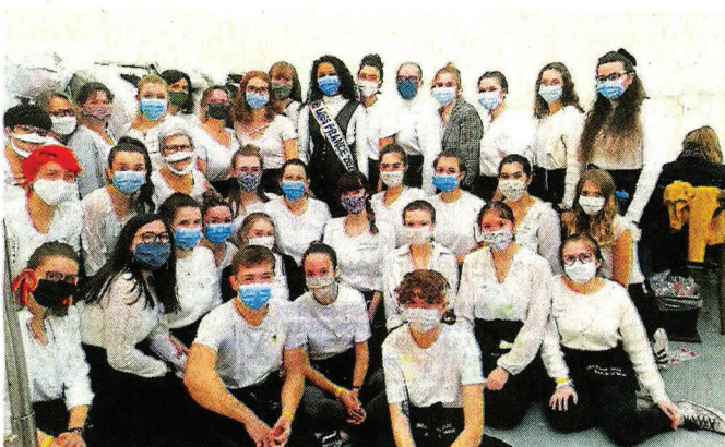
L'ensemble des élèves du lycée de la Mode ayant participé à l'élection de Miss France 2021.