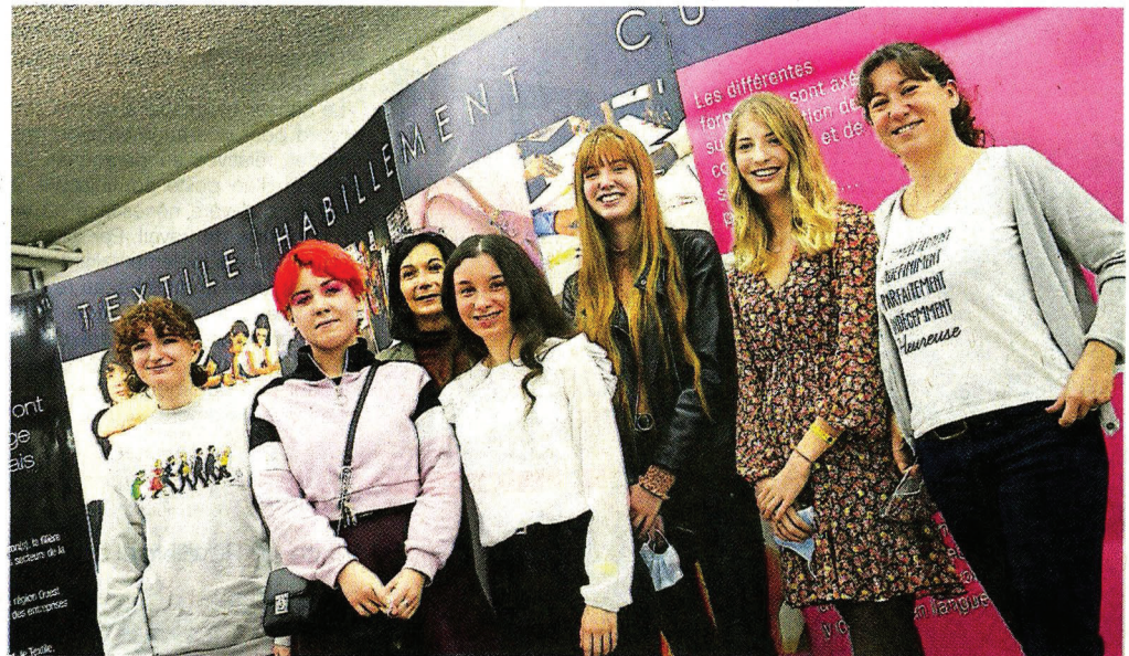
Une partie de l'équipe du lycée de la Mode, qui a eu la chance d'habiller les candidates à l'élection Miss France.

Une belle rencontre également avec la styliste de la cérémonie. « Les élèves ont pu voir tout le processus de la conception d'une robe de cérémonie, des croquis jusqu'à l'objet