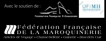
LE MEDIAPILOTE RCS Angers 494 121 836 - Tel. 02 41 70 05 12