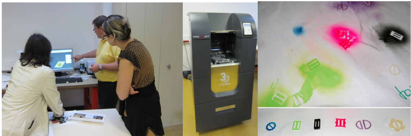
CAO sur SOLIDWORKS : conception des boucles Imprimante ProJet SD3000 : Impression 3D des boucles et coloration