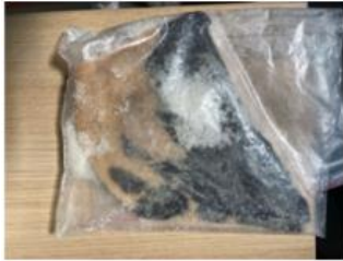
<- peau brute avant tannage

9h Mardi matin, nous avons rendez-vous pour une visite au CTC (Centre Technique du Cuir) qui fait partie du CPDE : Centre Professionnel de Développement Économique. Il effectue à la fois de la recherche et de la promotion pour la filière maroquinerie (aujourd'hui le secteur le plus puissant, comparé à la chaussure ou la ganterie). Ces trois pôles cuir sont d'ailleurs présents au CTC. Le Centre réalise également une veille sur les nouvelles alternatives (matériaux en raisin, etc.). En résumé, le Centre Technique s'efforce d'être le garant des métiers du cuir afin de perpétuer les techniques et savoir-faire ancestraux et d'assurer leur avenir. Début de la visite vers un autre bâtiment : la tannerie. Elle est présente au CTC pour permettre d'expérimenter la matière. Ils sont équipés pour transformer une peau brute sortie d'abattoir en un cuir fini et en utilisant tous types de tannage. Ils ont également un partenariat avec l'école ITECH, pour toute la partie chimie.